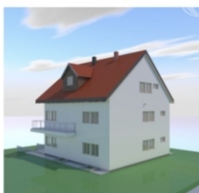
Hátsó kert felüli képek