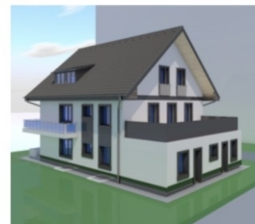
Hátsó kert felüli képek