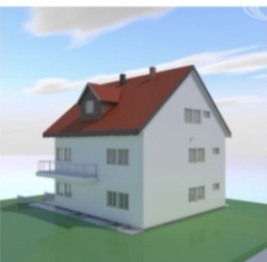
Hátsó kert felüli képek