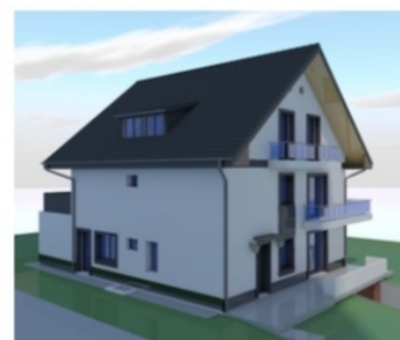
Utcafront felüli képek